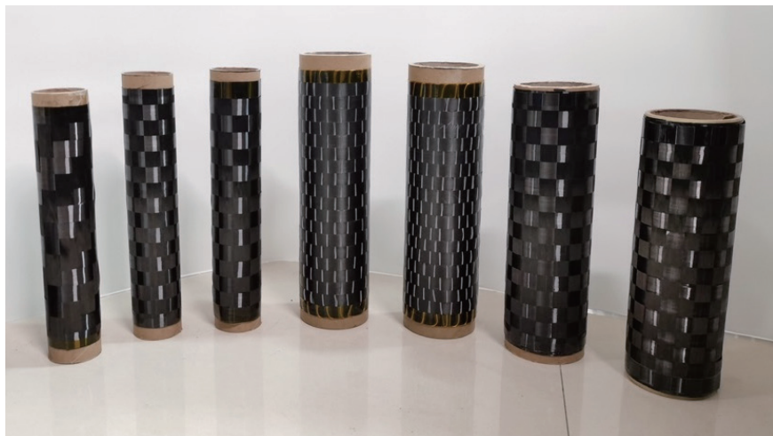
超薄热塑性碳纤维编织布